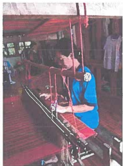
ภาพประกอบการเลี้ยงตัวไหมสู่เส้นไหมอันสวยงาม