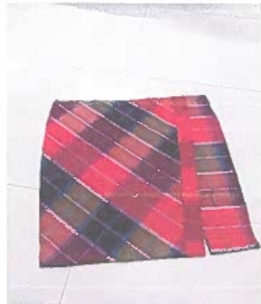
ภาพประกอบกลุ่มทอผ้าไหม