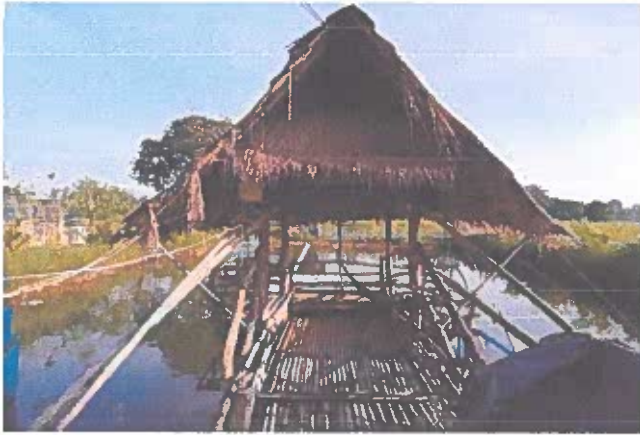
ภาพประกอบการเลี้ยงปลา